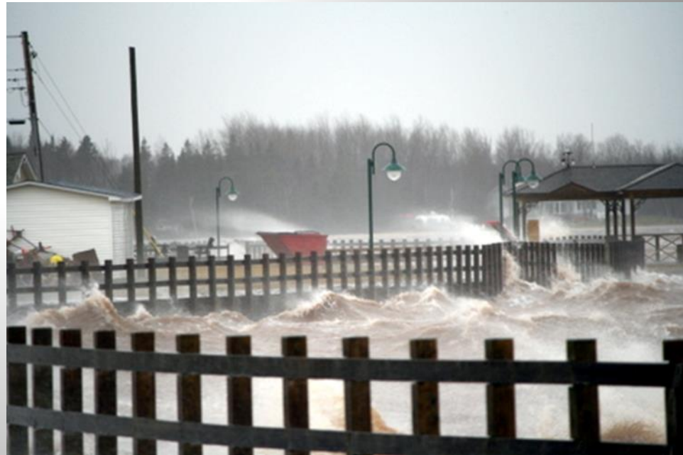
Shippagan, Déc. 2010.