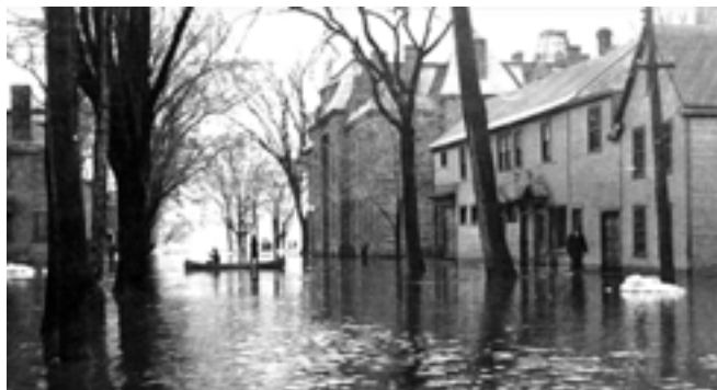
Rue St. John, Fredericton, 1936

L'inondation des zones côtières et intérieures figure parmi les plus grands risques naturels qui menacent les Canadiens de nos jours. Cela est d'autant plus vrai pour le Nouveau-Brunswick où, hier et aujourd'hui encore, on constate une tendance à s'établir près des rivières et sur les côtes océaniques, et où de nombreuses collectivités ont été établies dans des secteurs touchés par des inondations périodiques. Le Nouveau-Brunswick renferme environ 60 000 kilomètres de ruisseaux et rivières et environ 2500 lacs et mares de tailles variées. La province est également bordée par des milliers de kilomètres de côtes océaniques. Il n'est donc pas étonnant de constater que le Nouveau-Brunswick a connu son lot d'inondations qui ont eu des conséquences fâcheuses sur les établissements humains, des épisodes de gravité variable ayant été déclarés dès 1696. Les éléments déclencheurs des inondations varient selon la saison et l'emplacement. Les pluies abondantes constituent à elles seules la cause la plus importante d'inondations au Nouveau-Brunswick. Toutefois, la fonte des neiges et les embâcles en sont d'autres causes non négligeables, et les ondes de tempête affectent nos côtes océaniques. Même si certaines inondations sont attribuables à une seule cause, d'autres, comme les inondations de 2012 à Perth-Andover, s'expliquent par une combinaison des processus susmentionnés.