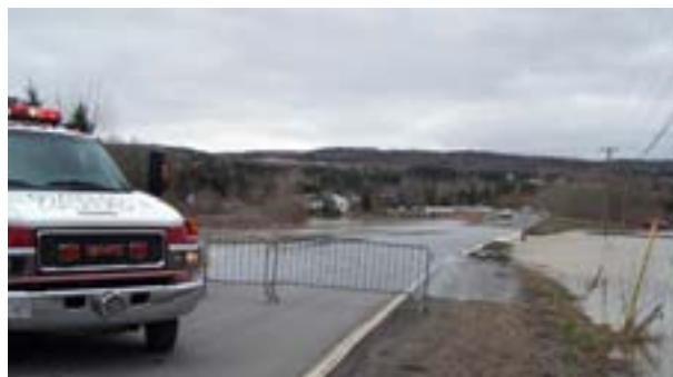
Inondation du printemps 2008

Améliorer les outils actuels qui appuient les efforts de gestion des mesures d'urgence en réaction aux inondations et s'en inspirer, notamment : a) faire participer les régions et les municipalités pour s'assurer que des plans d'évacuation et d'urgence sont préparés et que des exercices de simulation ont lieu; et b) chercher des outils améliorés d'avertissement et de prévision des inondations pour faciliter la planification d'urgence (par exemple, des plans d'évacuation en cas d'inondation plus détaillés et mieux intégrés).