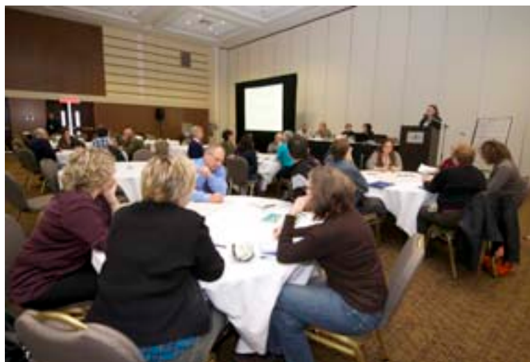
Engagement du public

Certaines mesures peuvent être appliquées à court terme, mais d'autres requerront plus de temps pour être mises en œuvre. À l'avenir, le gouvernement du Nouveau-Brunswick compte préciser les détails de la mise en œuvre qui accompagneront les mesures cernées dans la stratégie, y compris l'ordre de priorité de ces mesures et le calendrier à suivre pour commencer les activités.