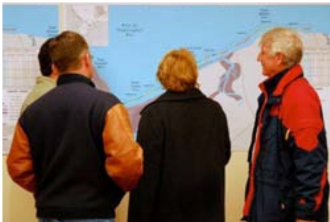
Réunion en aménagement du territoire

Bien que certaines collectivités du Nouveau-Brunswick aient utilisé ce pouvoir et pris des mesures pour déterminer les risques d'inondation et y réagir, d'autres ne l'ont pas fait. De plus, lorsque des politiques sur les inondations sont intégrées dans les documents de planification locaux, les règlements de zonage correspondants ne sont pas toujours mis en vigueur. Par conséquent, il n'y a pas d'uniformité dans la réaction aux risques d'inondation à l'échelle des collectivités de la province, et de nombreuses collectivités continuent de se tourner vers le gouvernement provincial pour obtenir des directives.