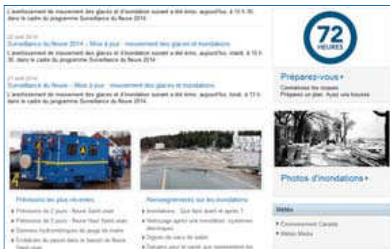
Site Web de Surveillance du fleuve

La planification d'urgence, associée aux prévisions des crues et aux avertissements d'inondation, constitue une composante clé de l'adaptation. Pour le moment, le gouvernement provincial exploite un centre hydrologique provincial au sein du ministère de l'Environnement et des Gouvernements locaux qui assure un suivi des ressources en eau de la province et produit des rapports à ce sujet, et diffuse des prévisions sur le débit et le niveau des eaux dans le bassin hydrographique du fleuve Saint-Jean. Ces prévisions sont utilisées dans le cadre du programme Surveillance du fleuve afin d'aviser le public des conditions du fleuve et des inondations potentielles, et d'aider l'Organisation des mesures d'urgence (OMU) du ministère de la Sécurité publique à recommander les mesures de précaution à prendre en matière de sécurité en cas de prévision d'inondation. L'OMU s'est engagée à ce que les plans et la planification d'urgence, tant à l'échelle provinciale et régionale que municipale, soient d'actualité, y compris les plans d'urgence de « tous les risques » et les plans d'urgence en cas d'inondation des régions et municipalités à risque. Environnement Canada émet des avertissements de tempête dans les régions côtières. Il diffuse de tels avertissements lorsqu'on prévoit des niveaux d'eau et des vagues anormalement élevés (ondes de tempête) qui risquent de causer des inondations dans les régions côtières.