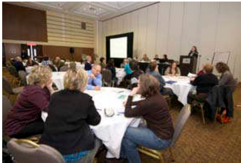
Engagement du public

Certaines mesures peuvent être appliquées à court terme, mais d'autres requerront plus de temps pour être mises en œuvre. À l'avenir, le gouvernement du Nouveau-Brunswick compte préciser les détails de la mise en œuvre qui accompagneront les mesures cernées dans la stratégie, y compris l'ordre de priorité de ces mesures et le calendrier à suivre pour commencer les activités.