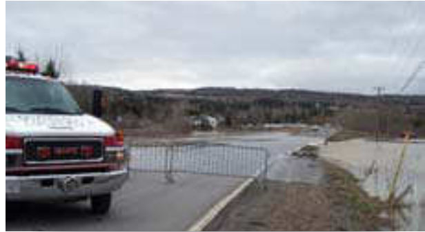
Inondation du printemps 2008

Améliorer les outils actuels qui appuient les efforts de gestion des mesures d'urgence en réaction aux inondations et s'en inspirer, notamment : a) faire participer les régions et les municipalités pour s'assurer que des plans d'évacuation et d'urgence sont préparés et que des exercices de simulation ont lieu; et b) chercher des outils améliorés d'avertissement et de prévision des inondations pour faciliter la planification d'urgence (par exemple, des plans d'évacuation en cas d'inondation plus détaillés et mieux intégrés).