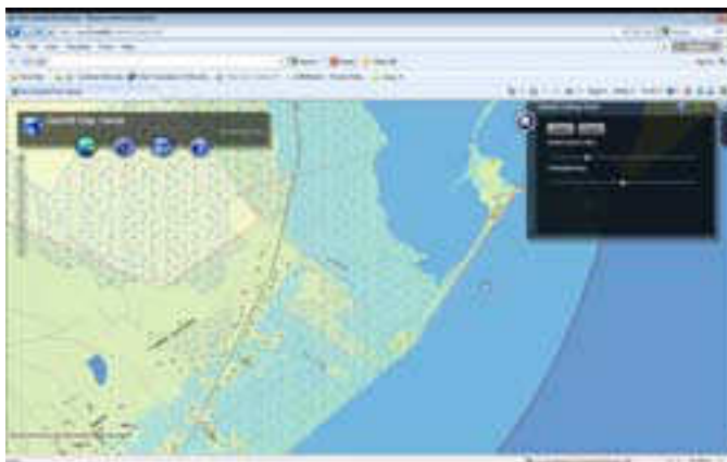
Exemple de l'information disponible sur le site Web de GeoNB