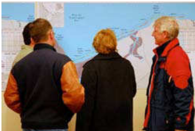
Réunion en aménagement du territoire

Bien que certaines collectivités du Nouveau-Brunswick aient utilisé ce pouvoir et pris des mesures pour déterminer les risques d'inondation et y réagir, d'autres ne l'ont pas fait. De plus, lorsque des politiques sur les inondations sont intégrées dans les documents de planification locaux, les règlements de zonage correspondants ne sont pas toujours mis en vigueur. Par conséquent, il n'y a pas d'uniformité dans la réaction aux risques d'inondation à l'échelle des collectivités de la province, et de nombreuses collectivités continuent de se tourner vers le gouvernement provincial pour obtenir des directives.